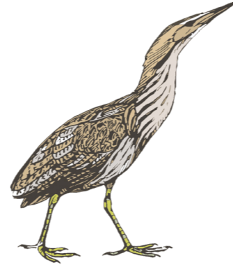
Kaulushaikara, Botaurus stellariksen pulloon puhaltamista muistuttavan kumean äänen voi kuulla Teijon kesässä.