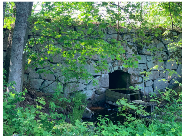
Ruukkikylät heräävät jälleen eloon. Kirjakkalan pato kevätassuunsa.

Kyläsauna suljettiin 17.3., keskellä kevään saunomisesonkia. Vaikka remonttipäätökset ovat rahallisesti isoja asioita, pystyimme koronapussin aikana tekemään saunalla uudistuksia. Tämän lehden ilmestyessä sauna on jälleen avattu. Viime kesän hyvät kävijämäärät ja kokemukset painoivat vaa'assa: päätimme jatkaa kolmella viikkovuorolla. Huolehdimme tehokkaasta siivouksesta sekä luotamme kyläläisten järkevään, vastuulliseen ja sääntöjä kunnioittavaan käyttäytymiseen yhteisissä tiloissa ja tilanteissa.