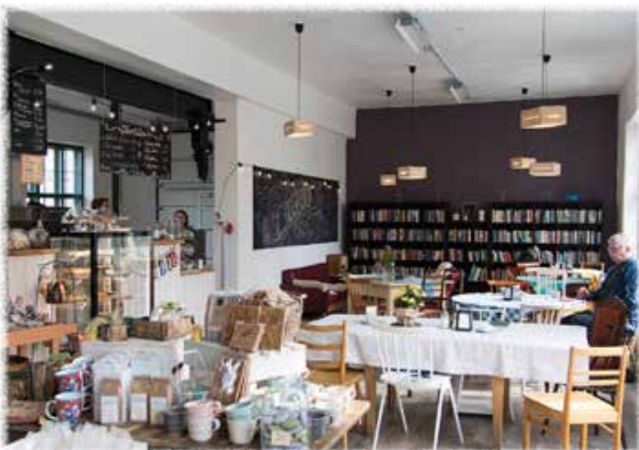
Hotelli Ruukin Majatalo. Kahdeksan kappaletta kahden hengen huoneita. Hotellin respa toimii huoneiden alapuolella olevassa Kyläkonttorissa, josta löytyy muun muassa maistuvia leivonnaisia, kirjoja sekä lahjatavaroita. Lisätiedot: info@mathildedal.fi tai p. 050 354 2487, www.mathildedal.fi, Ruukinrannantie 6, Mathildedal.