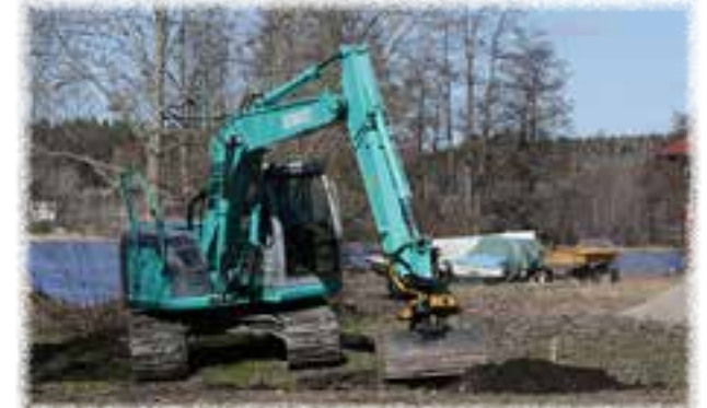
Teijon yhteisen vesialueen osakaskunta rakentaa kyläyhdistyksen kaupungilta vuokraamalle maa-alueelle grillikatoksen. Kyläläiset ovat mukana talkoissa.