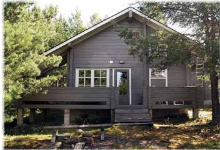
Meri-Ruukin lomakylä. 20 hirsimökkiä ja rantsauna, majoitustilaa yhteensä noin 120 hengelle. Lisätiedot: 0400 872 172, info@meri-ruukki.fi, www.meri-ruukki.fi. Kiikunmäentie, Mathildedal.