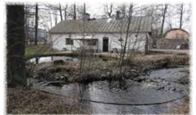
Teijon Kyläsauna on legendaarinen paikka, jonne tullaan säännöllisesti pitkienkin matkojen takaa.

Superior Knowledge in Marine Electrical Installations