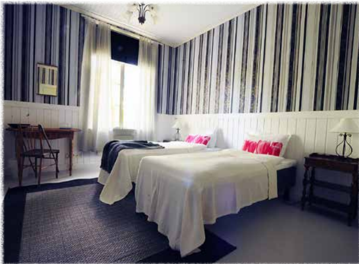
Pensionat Mathildedal. B&B-majoitusta, juhlatila. Majoitustilat yhteensä 14 henkilölle, juhlijoita mahtuu noin 30. Lisätiedot: p. 040 822 9250, info@pensionatmathildedal.fi, www.pensionatmathildedal.fi. Tullintie 17, Mathildedal.