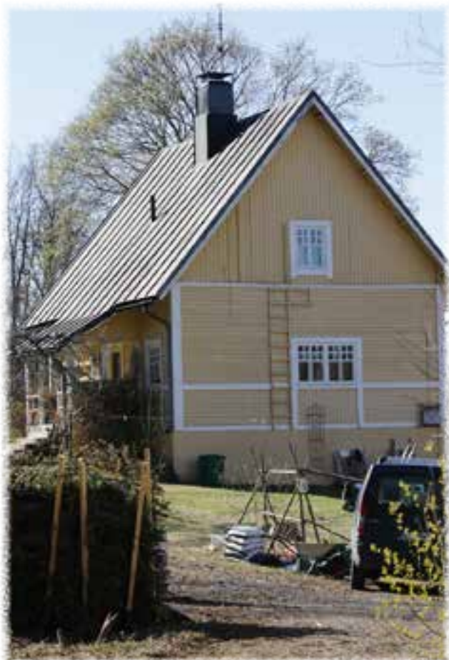
Teijon Metsänvartija B&B. Peti- ja aamiainen -periaatteella vuokrattavissa huone/huoneita aivan Teijon kansallispuiston kupeessa. Lisätiedot: 044 910 1348, Teijontie 23, Teijo.