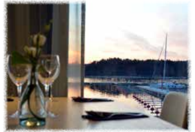
Mathildan Marina.

www.luontoon.fi/teijo www.meriteijo.fi www.ruukkikyla.fi www.sypressi.fi www.mathildanmarina.fi www.meriteijogolf.com www.teijo.fi (Teijon kyläsauna) www.teijonpunaportti.fi www.teijonmasuuni.fi www.pensionatmathildedal.fi www.matildatalo.fi www.mathildedal.fi