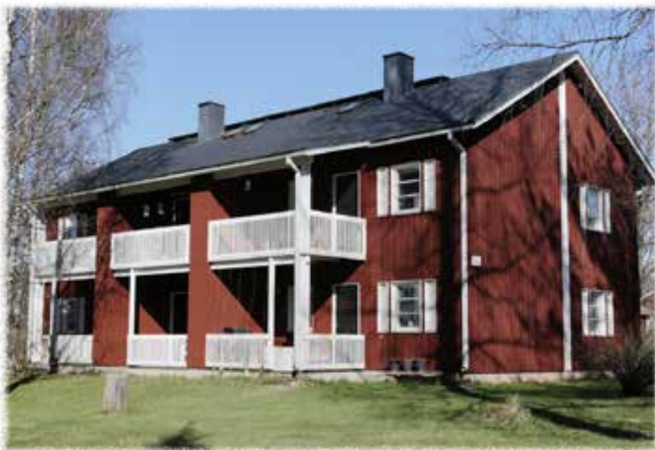
Meri-Teijo Center. Majoitukset Mathildedalin Ratsutalon mukavissa yksioisissa lähellä Mathildedalin rantaa. Lisätiedot: 02 736 3801, info@meri-teijo.com, www.meri-teijo.com, Matildan puistotie 4, Mathildedal.