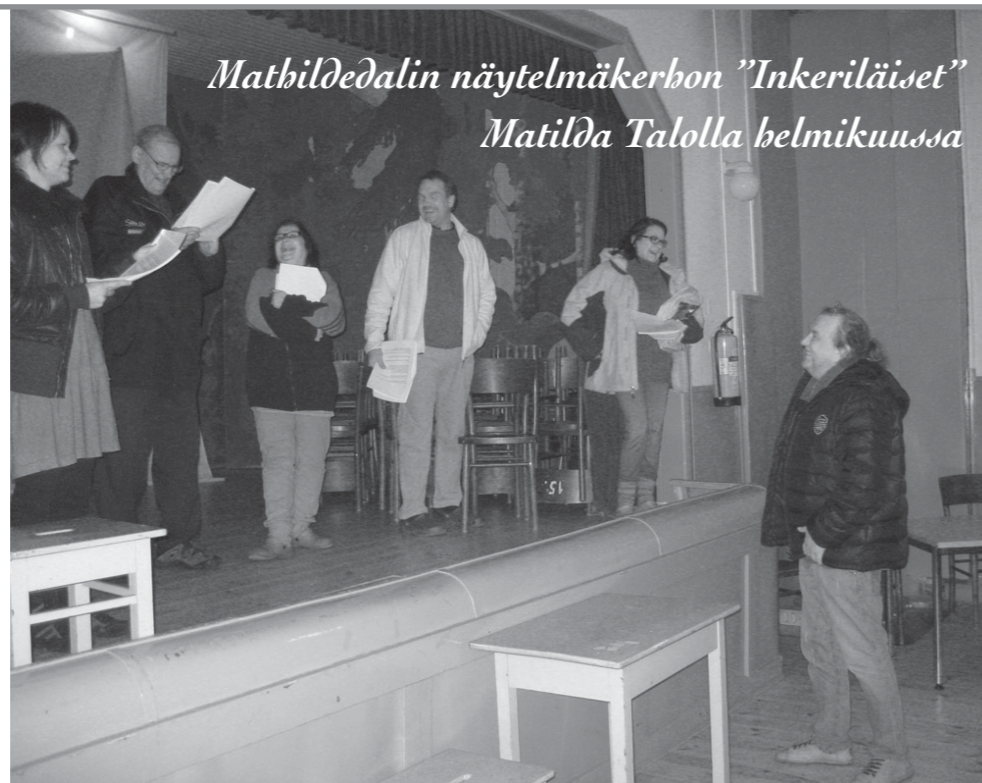
Mathildedalin näytelmäkerhon "Inkeriläiset" Matilda Talolla helmikuussa

Näytelmän sanoma ei voisi olla ajankohtaisempi. Jore peräänkuuluttaa suvaitsevaisuutta nykyiseen suomalaiseen sielunmaisemaan. Kun eletään ankaria aikoja ja toisilleen vieraat kohtaavat, heräävät pelot ja ennakkoluulot. Näytelmää katsoessa on mahdollista olla peilaa-